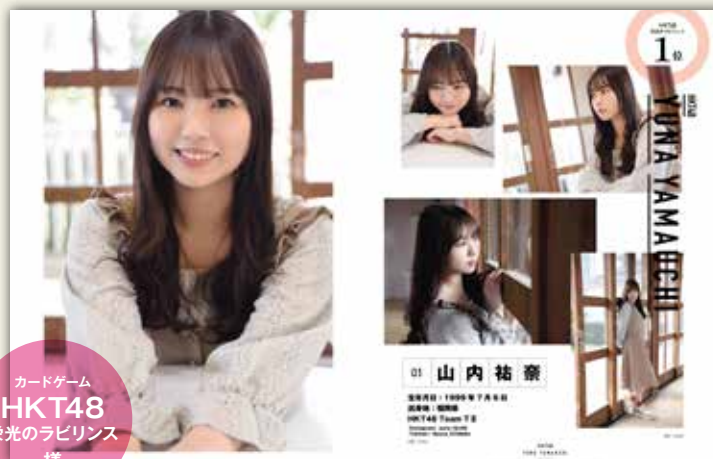
カードゲーム HKT48 栄光のラビリンス 様

今まで「BIG ONE GIRLS」では 様々な企業様とコラボレーションして企画、イベントを開催しております。 カードゲーム「SKE48 Passion For You」様や「HKT48 栄光のラビリンス」様で 増刊の表紙、グラビアをかけたコラボ企画を開催。 その後、発売記念のトーク&お見送り会も開催致しました。 また「LINE LIVE」様でも誌面掲載をかけたイベントを開催しています。