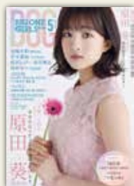
2022年5月号 表紙：櫻坂46 原田葵