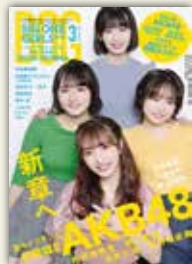
2022年3月号 表紙：AKB48 向井地美音・田口愛佳 浅井七海・倉野尾成美