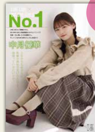
LINE LIVE 様